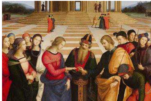
Lo sposalizio della Vergine di Raffaello.

Arte. Expo: da Leonardo a Giotto, 26 grandi mostre a Milano