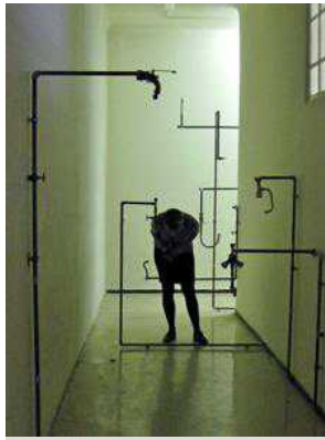
Opera in mostra a La Fabbrica del Vapore