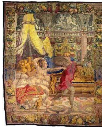
Giuseppe fugge dalla moglie di Putifarre

Roma, 25 novembre 2014 - E' stato presentato oggi al Quirinale il progetto della mostra "Il Principe dei sogni. Giuseppe negli arazzi medicei di Pontormo e Bronzino", che raduna insieme, per la prima volta dopo centocinquanta anni, i venti arazzi cinquecenteschi commissionati da Cosimo I de' Medici per la Sala de' Dugento di Palazzo Vecchio. Gli arazzi raffigurano la storia di Giuseppe e nel 1882 furono divisi per volere dei Savoia tra Firenze e il Palazzo del Quirinale.