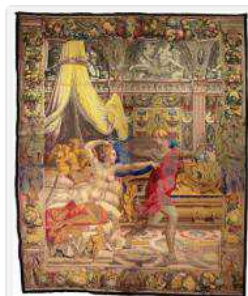
mostre Expo 2015 – Giuseppe fugge dalla moglie di Putifarre, cartonista Agnolo Bronzino, arazziere Niccolò Karcher, metà XVI sec

ARCHIVIATO IN: ARAZZI MEDICEI, GIUSEPPE NEGLI ARAZZI MEDICEI DI PONTORMO E BRONZINO, MOSTRA IL PRINCIPE DEI SOGNI, MOSTRE 2015 PALAZZO REALE