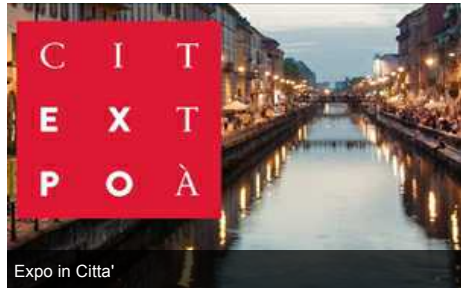
Expo in Città'