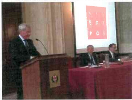
Expo alleanza per Milano

(Sesto Potere) – Milano - 2 maggio 2014 – A un anno esatto da Expo Milano 2015, il Comune e la CAMERA DI COMMERCIO DI MILANO hanno presentato il 30 aprile a Palazzo Marino in Sala Alessi "Expo in Città" e il palinsesto di "Expo in Città Maggio 2014", più di 130 eventi che per trenta giorni animeranno le strade, le piazze e i quartieri, dal centro alle periferie, con un palinsesto di alto livello. Una vera e propria anteprima dei 184 giorni di eventi del 2015.